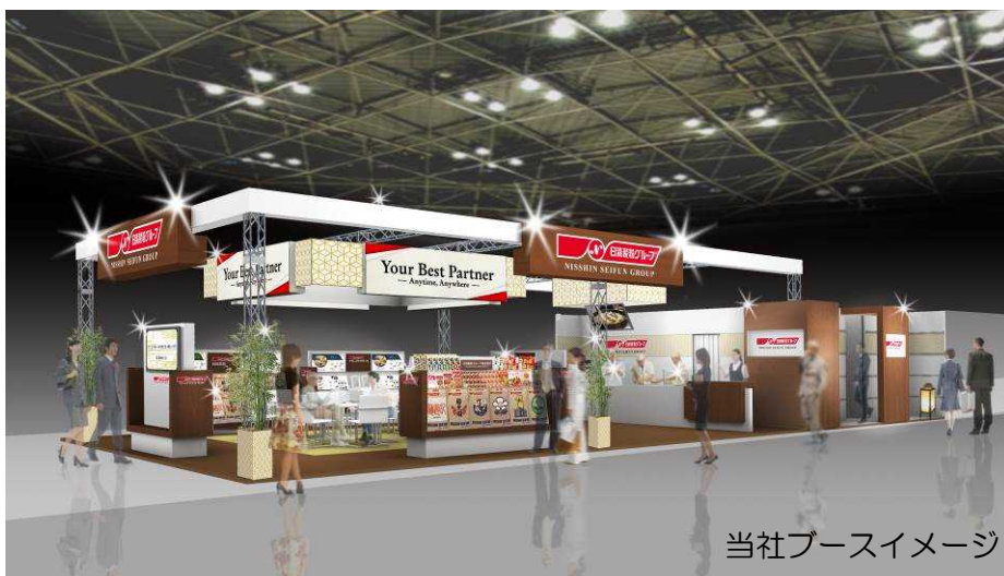
当社ブースイメージ

「第1回“日本の食品”輸出EXPO」は、政府が策定した「2019年の農林水産物・食品の輸出額1兆円」目標の達成に向けた様々な施策の重要な柱の一つとして、今年度初めて開催される海外バイヤー向けの商談展です。