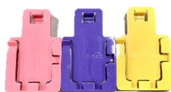
選べるラベルカラー