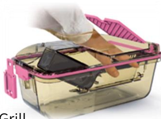
Top Open Grill