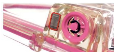
Magnetic Locking System